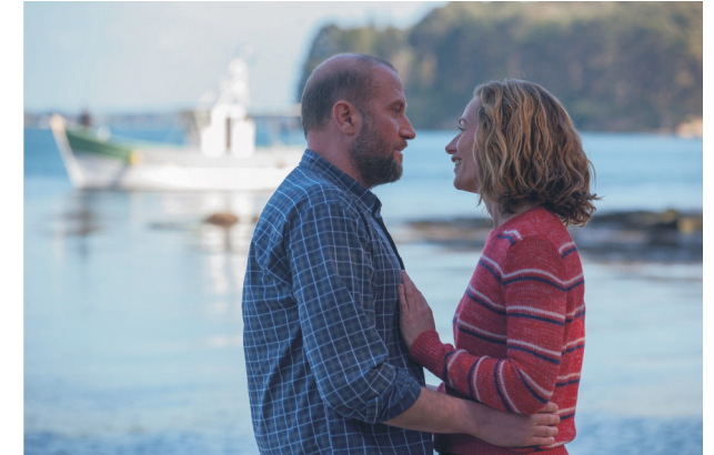
Otez-moi d'un doute (Frankreich 2017)