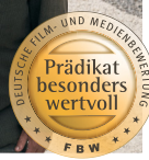
Zwei Herren im Anzug (Deutschland 2018)

Regie: Josef Bierbichler Mit: Josef Bierbichler, Simon Donatz, Martina Gedeck