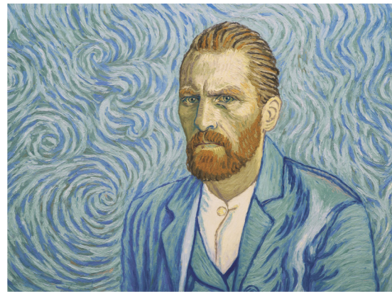
Loving Vincent (Großbritannien / Polen 2017)