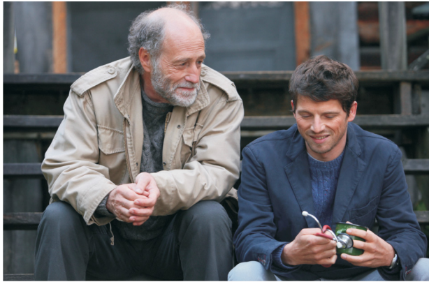
Le Fils de Jean (Frankreich 2016)

Regie: Philippe Lioret Mit: Pierre Deladonchamps, Gabriel Arcand, Catherine de Léan Drama, FSK: ab 6 Jahren, Länge: 98 min.